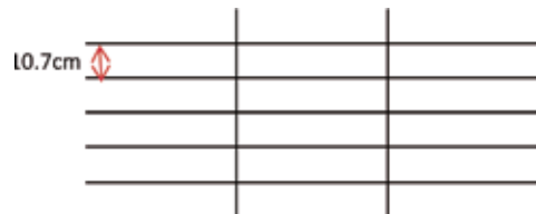
■ REFUERZO DE ACERO